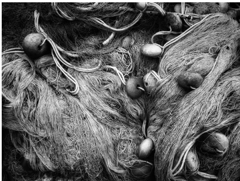
Filena Fortinguerra, Anche in fondo al mare .

L'autrice degli scatti è Filena Fortinguerra.