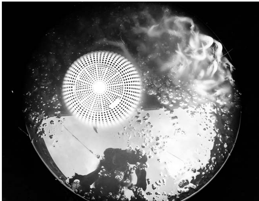
Filena Fortinguerra, Luna diamante .