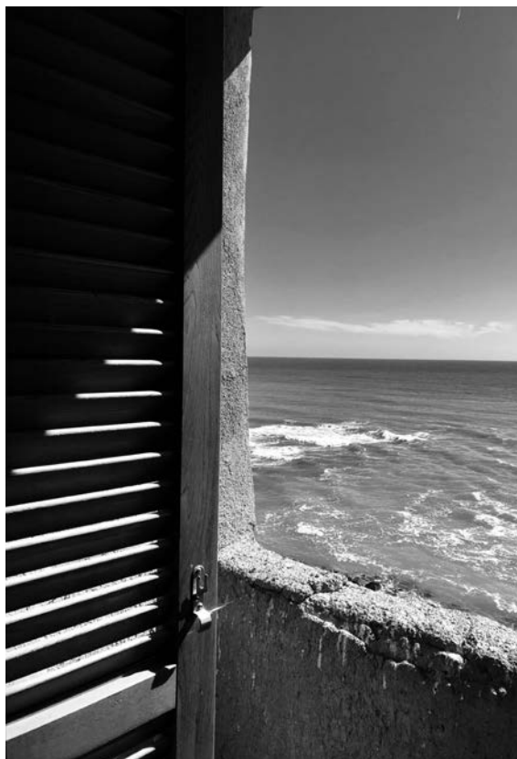
Filena Fortinguerra, Ti aspetto ancora.